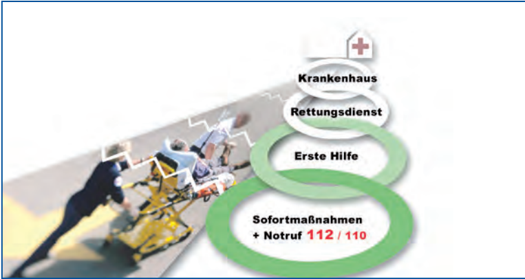
Abbildung 2: Die Rettungskette

In vielen Fällen zählt jede Minute. So sinkt die Überlebenschance beim Herzstillstand circa um 10 Prozent je Minute. Daher muss die Erste Hilfe schnell und wirksam sein.