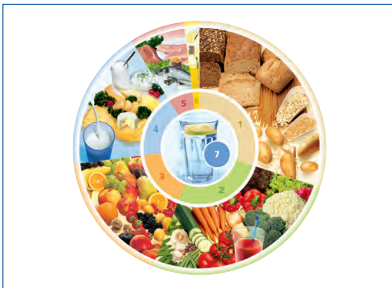
Abbildung 4: DGE-Ernährungskreis® (© Deutsche Gesellschaft für Ernährung e. V., Bonn)

Eine der bekanntesten und gängigsten Empfehlungen für eine ausgewogene Ernährung ist der Ernährungskreis der Deutschen Gesellschaft für Ernährung e. V. (DGE). Die Größe der Segmente, die auf der Grundlage der Referenzwerte für die Nährstoffzufuhr berechnet wurde, verdeutlicht das Mengenverhältnis der einzelnen Lebensmittelgruppen zueinander.